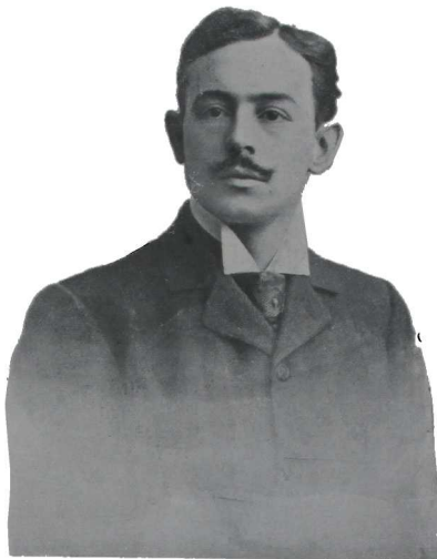
MR. DU TILLOY DEL TEATRO «VICTORIA»

Yo no creo que realizarlo, siquiera en parte, sea obra imposible en América; y digo en América, porque, al fin, idénticos elementos étnicos y geográficos han contribuido, con mayor ó menor intensidad, para formar las sociedades americanas del presente. Sería un absurdo sostener, circuncribiéndonos ya á la República Argentina, que nuestro país no tiene psicología, cualquiera que sea su carácter.