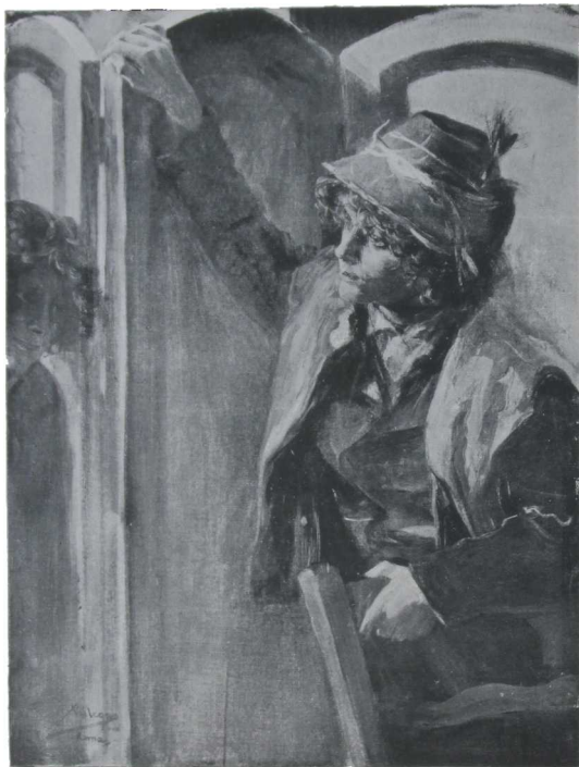
EL SABOYANO—DE JOSÉ VILLEGAS