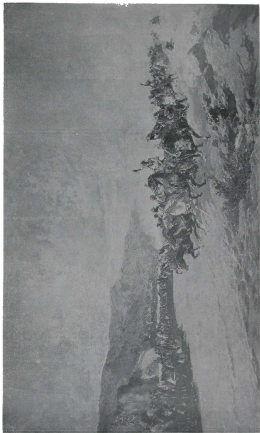
CARRERA DE UTAÑOS. - DE BALDORNO UALOPER