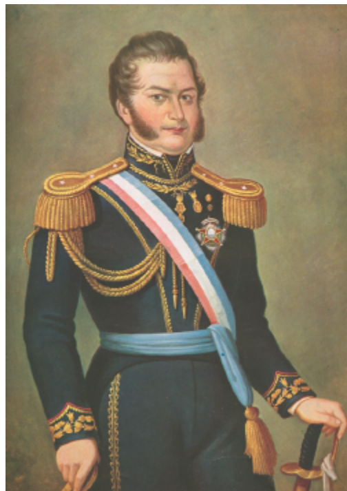
Bernardo O'Higgins, óleo de José Gil de Castro 1819. Museo Histórico Nacional. Buenos Aires.