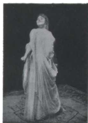
Deseo de venganza