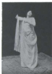
Invitación de amor.