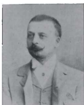
TEATO E. BOLTER BULGERINI Verdi