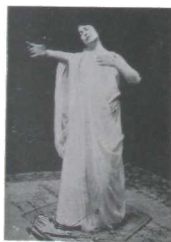
¡ No comprendes mi amor!