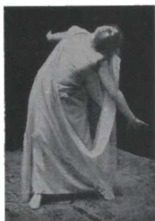
¡El corazón ya es de mármol!