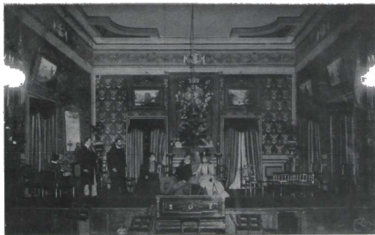
LO CURSI - DE JACINTO BENAVENTE - ACTO 1.º - ESCENA 3.ª