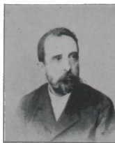
JEAN ROGG Beethoven