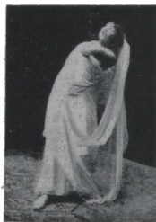
¡El veneno llega al corazón!