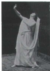
¡El veneno de Medea arde en mis venas!