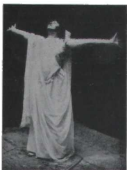
¡Venus me posee!