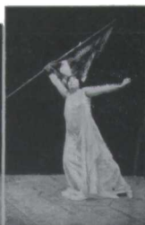
Toujours en avant!