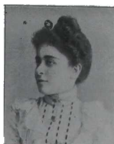
STA. AURORA FERRASE Buenos Aires