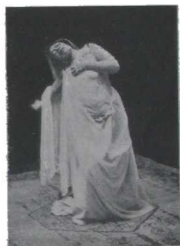
Mis ojos ya no ven. ¡Es la muerte!