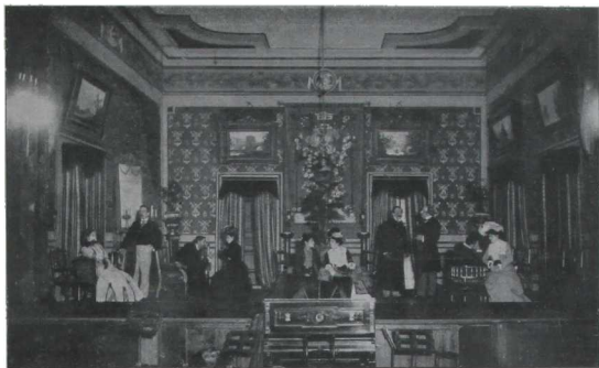
LO CURSI - DE JACINTO BENAVENTE - ACTO 1.º - ESCENA 3.ª

Las dos fotografías que publicamos, dan una idea de la mise en scene del Argentino y del encomiable esfuerzo que la empresa de ese teatro hace para colocar sus espectáculos a un nivel primario, cuidando escrupulosamente esos detalles escénicos tan nimios al parecer, y tan importantes para la entonación y armonía del conjunto artístico. La mise en scene de Electra , lo mismo que la de Lo cursi , han resultado dignas de cualquier escepticismo.