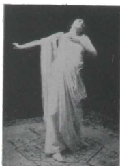
¡ Ingrato, todavía te amo!