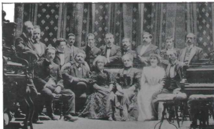
GRUPO DE ARTISTAS QUE TOMARON PARTE

En el concierto tomaron parte además las seño-