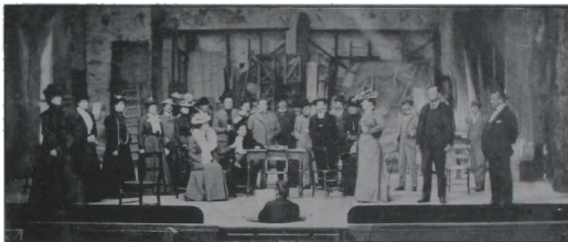
PRIMER ENSAYO DE LA COMPAÑIA DELLA GUARDIA—MME. SANS GÈNE