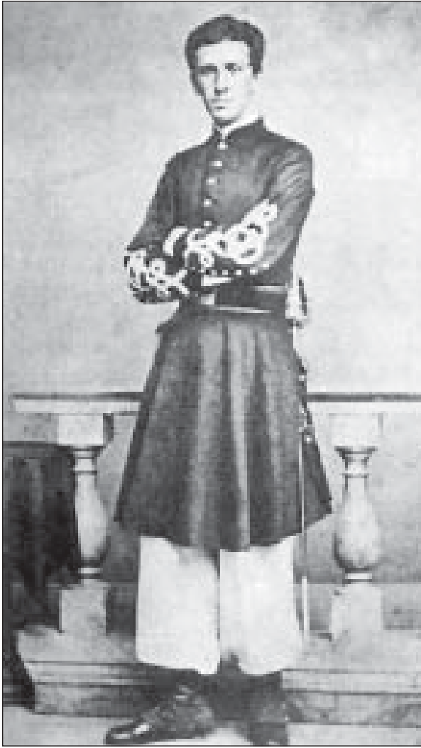
Domingo Fidel Sarmiento ( El ) en uniforme de capitán de infantería de línea.