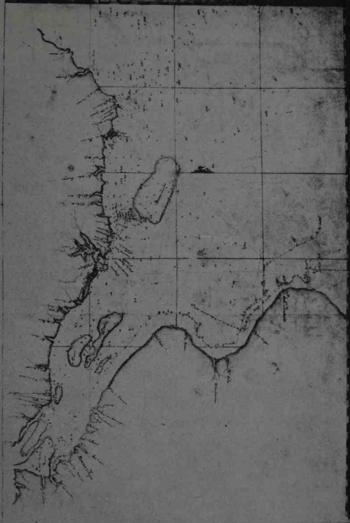
Carta patrón del Río de la Plata levantada por la Expedición Malaspina, en 1789. (Ejemplar facilitado por la Librería L'Amateur, cuya contribución agradece la C. de P.)